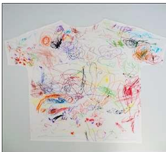
Figur 2. De yngre barnens t-tröja med eget motiv (Forsberg Ahlcrona, 2016).

möjliggöra för barnen, att återkomma till uppgiften med nya tankar och avsikter att välja olika färger och prova nya mönster. Barnens dekorerande av tröjan kan mycket väl börja som en planerad aktivitet och därefter utvidgas till spontana samtal kring det som barnen ritat under dagen. På så sätt kan miljön i förskolan utvecklas till en lärmiljö som uppmuntrar barnens nyfikenhet och intresse för det som erbjuds genom att de får undersöka, prova och fundera över sina erfarenheter. I dialogen med vuxna kan barnen få möjlighet att lära sig nya ord och få stöd att använda dessa för att beskriva sina upplevelser och kunskaper (Jonsson, 2016; Pramling Samuelsson & Jonsson, 2017).