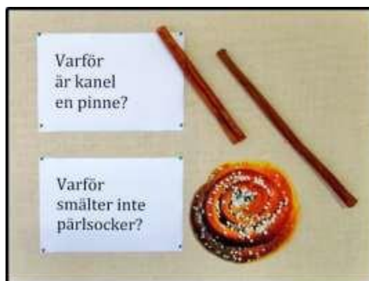
Figur 3. Barnens varför -frågor att fundera kring tillsammans (Forsberg Ahlcrona, 2016)