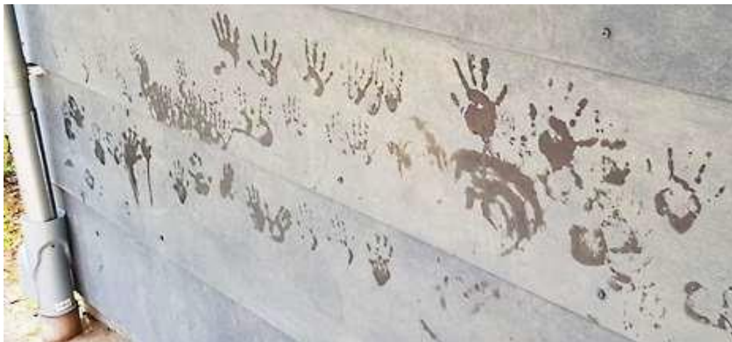
Figur 5. Väggen med barnens våta handavtryck torkar i solen

Därefter var det färgernas tur att ”sjunga” Imse Vimse spindel. Den röda färgen i figur 6 är en uppstigande sol och den blågröna är regnet som faller, skapat genom att barnen drog med fingrarna uppifrån och ner.