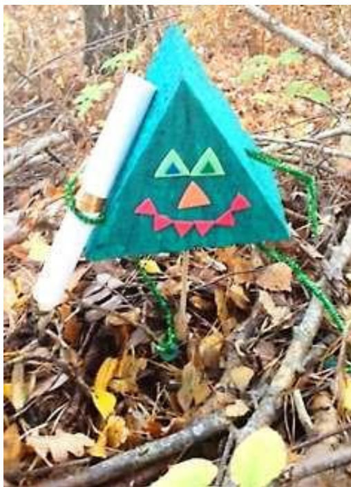
Figur 1. En triangel med en inbjudan till trianglarnas kalas (Forsberg Ahlcrona, 2016)

uppleva olika triangelformer: liksidiga, likbenta och rätvinkliga. Därefter uppmuntrades barnen att på olika sätt upptäcka och skapa egna triangelfigurer.