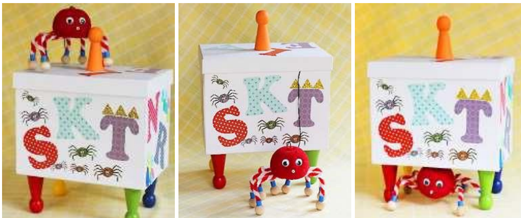
Figur 8. Spindelns position på, framför och under lådan