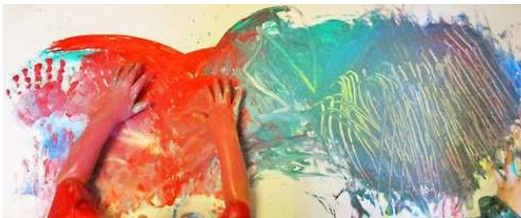
Figur 6. Färger som visar ”upp stiger solen” och ”ner faller regnet”

Därefter var det färgernas tur att ”sjunga” Imse Vimse spindel. Den röda färgen i figur 6 är en uppstigande sol och den blågröna är regnet som faller, skapat genom att barnen drog med fingrarna uppifrån och ner.