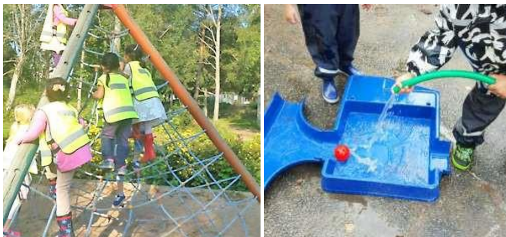
Figur 4. Barnen klättrar som konkretisering av ”klättrar upp för trä'n” och spolar vatten som konkretisering av ”spolar spindeln bort”

På en förskola i en större stad genomfördes ett tema där flera olika uttrycksformer användes, bland annat sång, dramatisering och bild. Barnen sjöng sången ”Imse Vimse spindel”, men de förstod inte vad klättra , spola och torka betyder. Därför konkretiserades dessa begrepp genom att barnen fick klättra, spola, hälla, spruta och torka, se figur 4. På gården fick barnen göra avtryck med blöta händer och solen torkade bort dem, se figur 5. Sedan fick barnen torka vatten på golvet med en trasa. Trasan torkades i torkskåpet och vuxna blåste varm luft med hårtork på barnens händer så att de torkade.